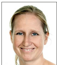
Munch, Kathrine Lærer Matematik, life skills, idræt