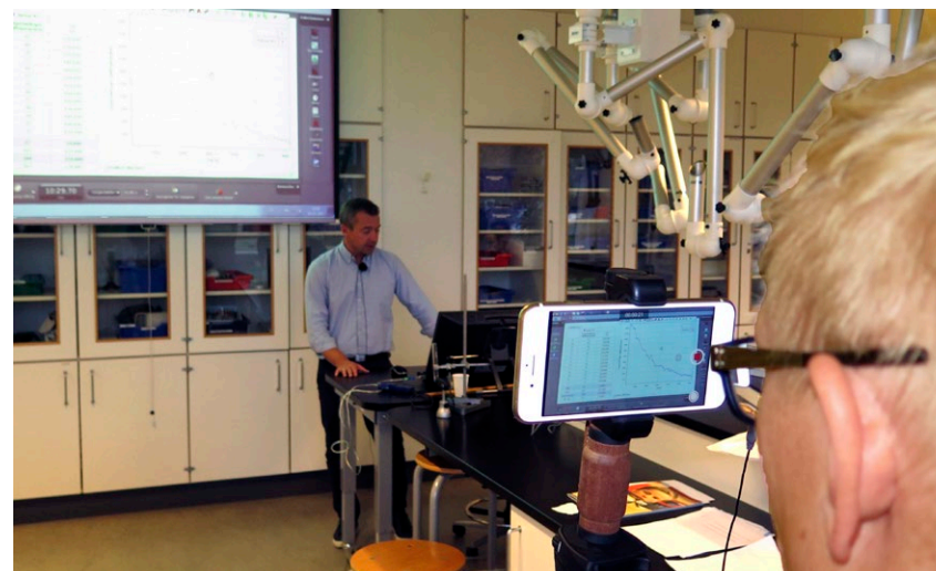
Optageudstyr til videovejledninger er et af de nye tiltag, som midlerne fra Novo Nordisk Fondens pris har muliggjort.