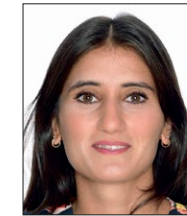
Dagdalen, Sibel Lærer Dansk, kristendom, aktivitet, læsestøtte, tema trivsel