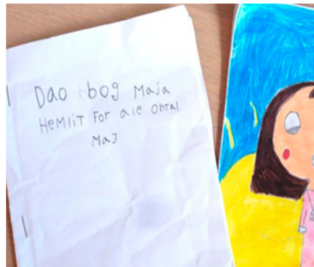
Børnestavning. "Majas hemmelige dagbog"