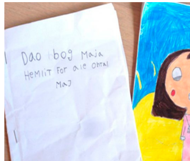
Børnestavning. "Majas hemmelige dagbog"