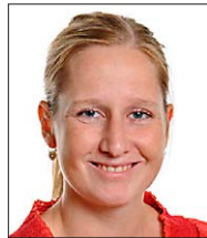
Munch, Kathrine Lærer Matematik, tema, idræt, svømning