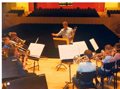
Elever fra Randers Realskole i symfonisk sal, Århus Musikhus

Randers Realskoles Brass Band har netop indledt et spændende samarbejde med opvisningsgymnastikholdet "Randers Real Show 'n Tumbling" om en fælles orkester/ gymnastikrejse til Hazebrouck i Nordfrankrig i påsken 2012.