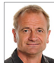
Brøndum, Jan Lærer Matematik, tema