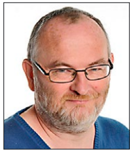
Murmans, Christian Lærer Matematik, naturfag, fysik, tema